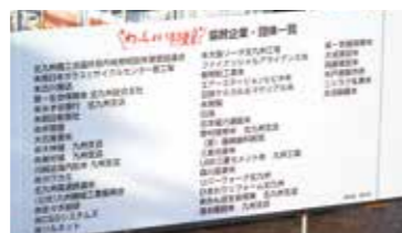
⑦会場内看板イメージ