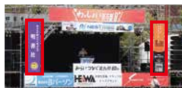
③ケコミ看板イメージ