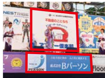
②メインステージ看板イメージ