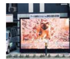
⑭アース室町ビジョンイメージ