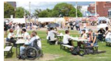
⑪テーブル協賛 ※設置場所イメージ