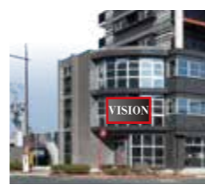
⑭アンサービジョンイメージ