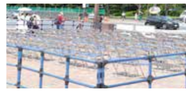
⑩会場内椅子カバー ※設置場所例