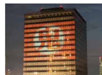
⑮プロジェクター協賛イメージ