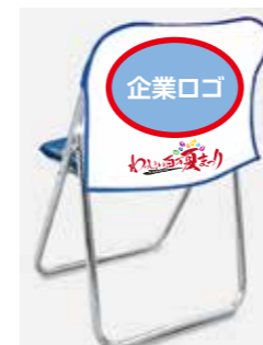
⑩会場内椅子カバー ※設置イメージ