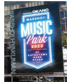
①ネーミングライツイメージ

※複合的な内容の為、申込締切については他の協賛メニューをご参照いただけますようお願いいたします。