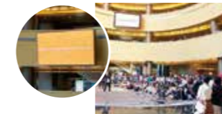
⑬アンサービジョンイメージ