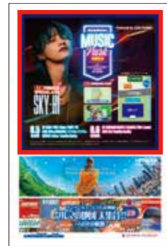
②プログラムイメージ