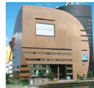
⑫屋外ビジョンイメージ