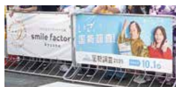
⑧横断歩道フェンス幕