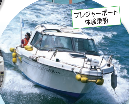
プレジャーボート体験乗船