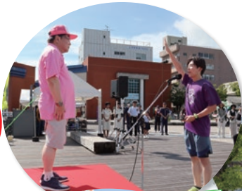
SWIM & RUN

◀◀ 門司港レトロ地区と西海岸地区 ▶▶ ◀◀ 第一船溜まり及びその周辺海域 ▶▶