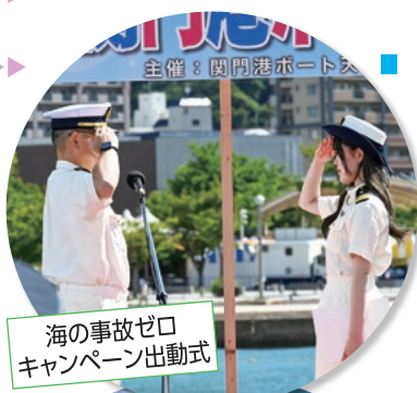
海の事故ゼロキャンペーン出動式