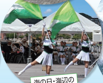
海の日・海辺のコンサート